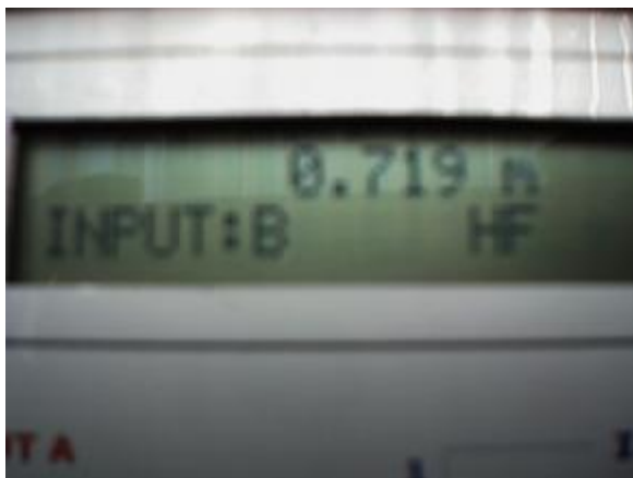
Aanduiding in golflengte