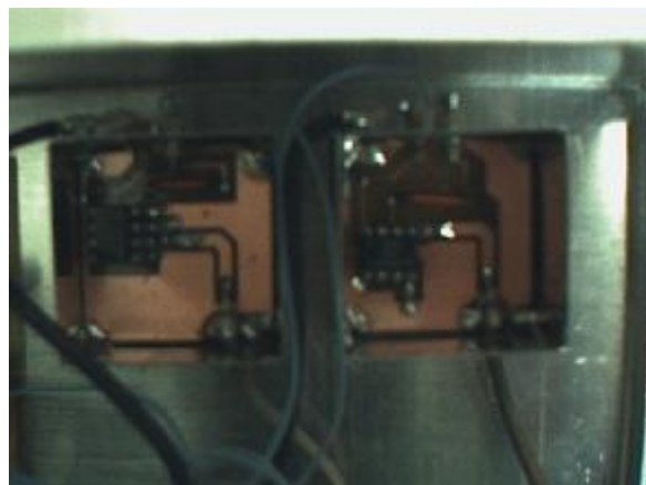
De prescalers: links de U664BS en rechts de MB506