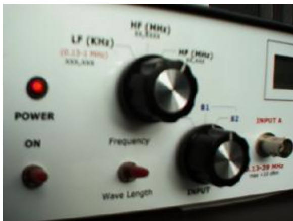
De bereichschakelaar, ingangschakelaar en golflengte schakelaar